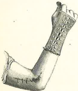
FIG. 5. — Le poignet orthopédique vu de la face dorsale.

extenseurs, et ainsi facilite le retour des mouvements de la main