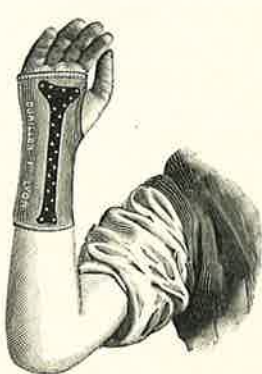
FIG. 6. — Le poignet orthopédique vu de la face palmaire.

si la paralysie radiale s'améliore et corrige partiellement l'infirmité si elle devient définitive.