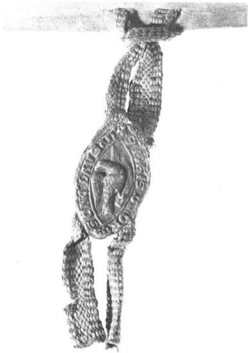
Sceau de Jean d'Oron (GALBREATH, p. 200, n o 5) au bas d'un acte de 1248 (GUMY 472; v. p. 47). Le motif — l'aigle de saint Jean tenant un phylactère — renvoie au prénom.