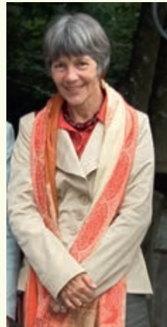
F. Imhof © UNIL