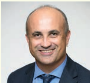
Félix Imhof © UNIL

La chouette effraie: une prédatrice stratège en négociation et paix. Leçon inaugurale d'Alexandre Roulin. Biophore, amphithéâtre