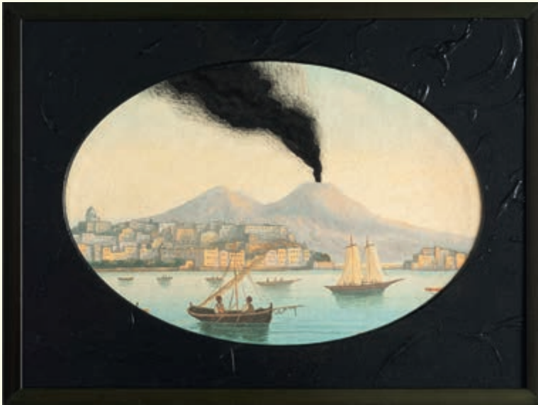
© Jean-Claude Schauenberg, Gay-Odin , technique mixte sur carton, 2013

A l'occasion de l'exposition, parution aux éditions art&fiction d' Attitudes et latitudes , conversation entre Françoise Jaunin et l'artiste