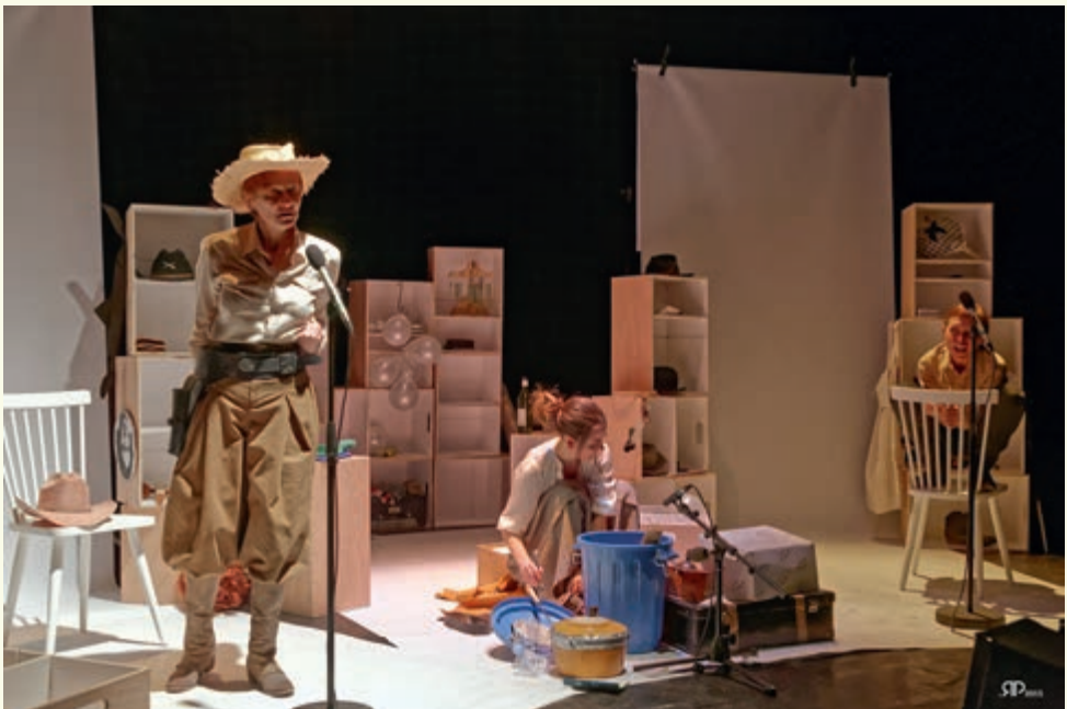
  Philippe Rappeneau

Pour les groupes de dix personnes ou plus, nous ne prenons pas les r servations sur formulaire. Merci de nous appeler au 021 692 21 27 pour effectuer votre r servation!